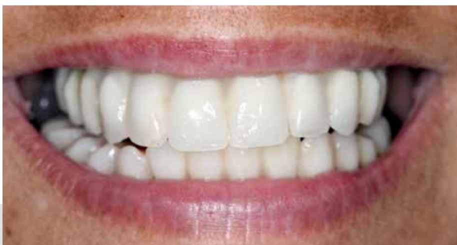
Resultado final del tratamiento

Gracias a la excelencia en el trabajo de nuestros profesionales, a la tecnología y a las más avanzadas técnicas odontológicas, en IGB DENTAL hacemos posible que la calidad de vida de nuestros pacientes mejore y que todo el mundo consiga la sonrisa con la que siempre había soñado.